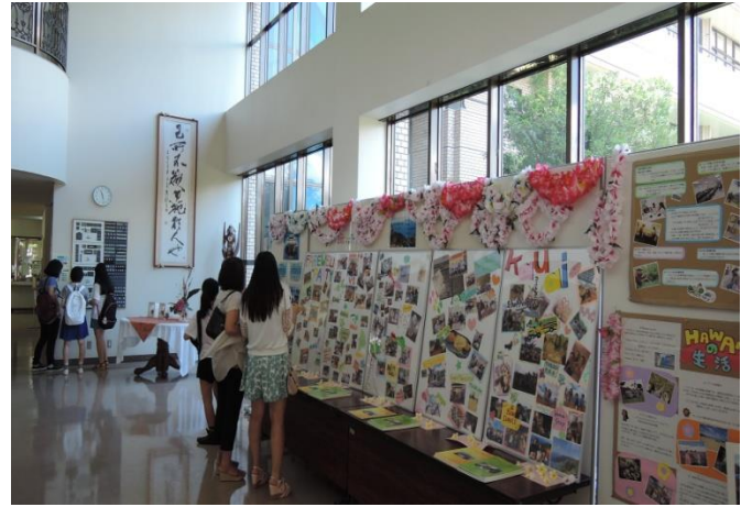
「ハワイセミナー紹介」