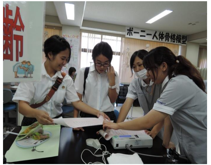
「知りたい！見たい！からだのしくみ」