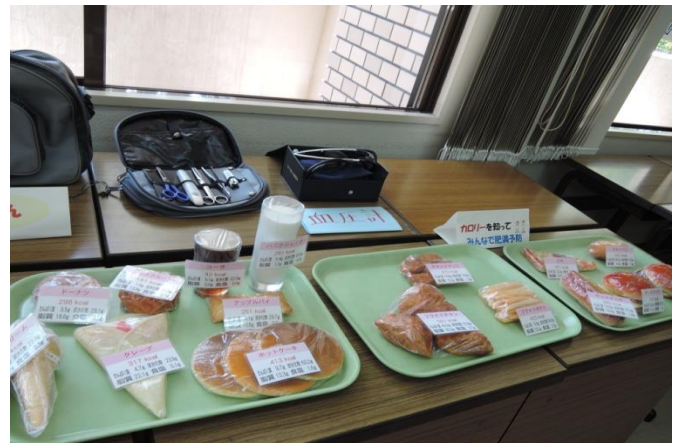
「保健師ってなあに？」