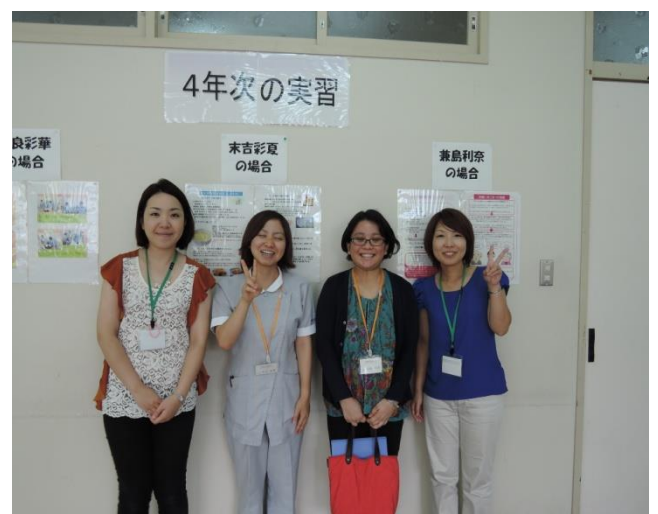
「高齢者看護のいろいろ」