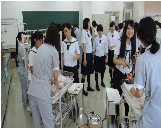
「赤ちゃん教室へようこそ！」