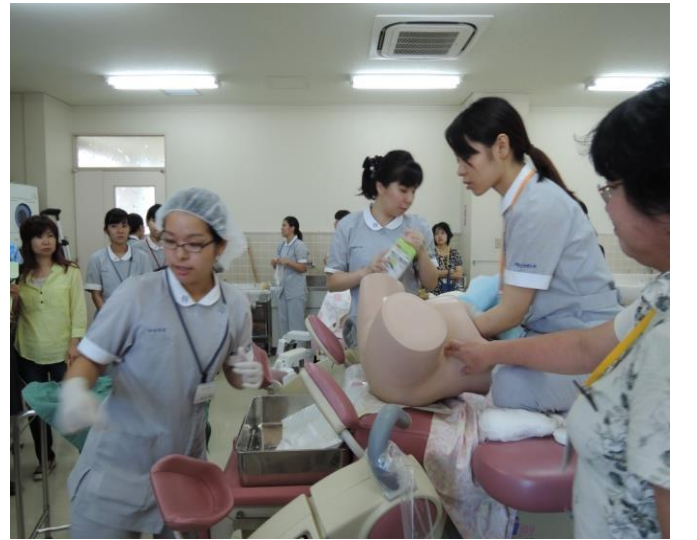
LOVE & 命の誕生