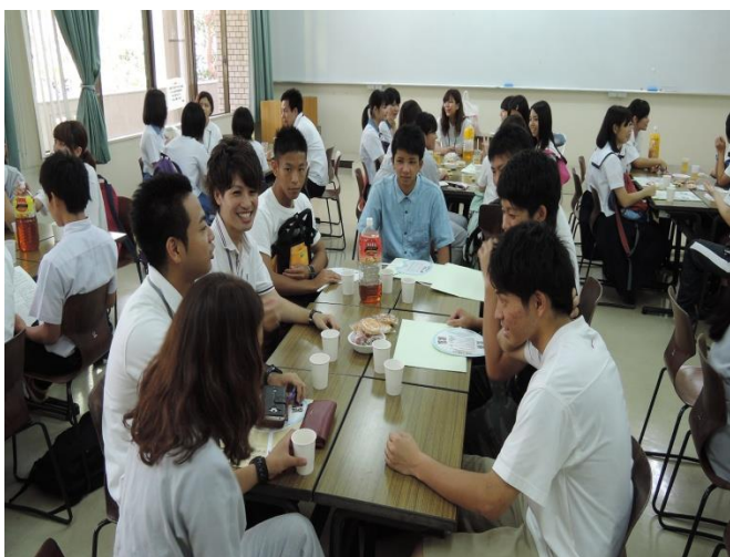
「在学生・卒業生とのフリートーク」