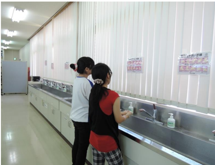
「やってみよう！血圧測定と手洗い」