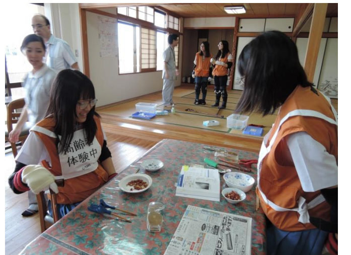
「あなたの未来体験」