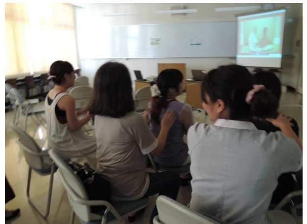
「心を癒やすタッピング・タッチ」