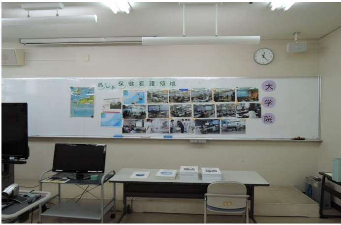
「島しょ看護はすばらしい！」