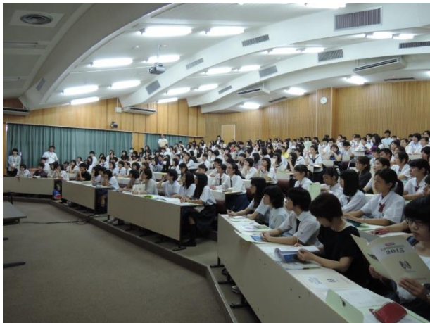
「大学紹介・入試説明会」