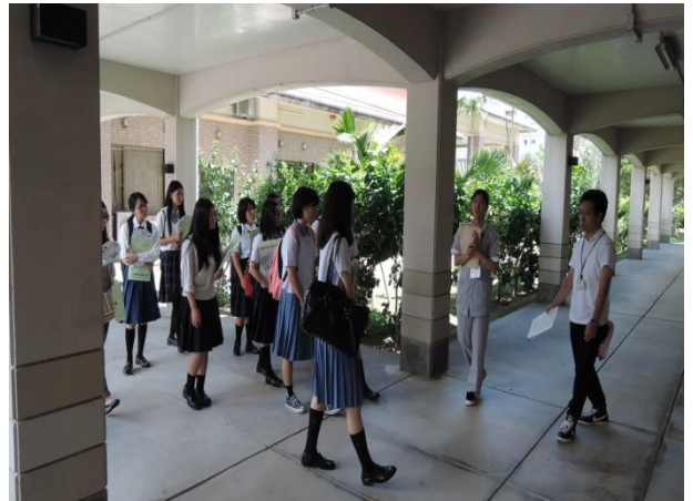
「キャンパスツアー」