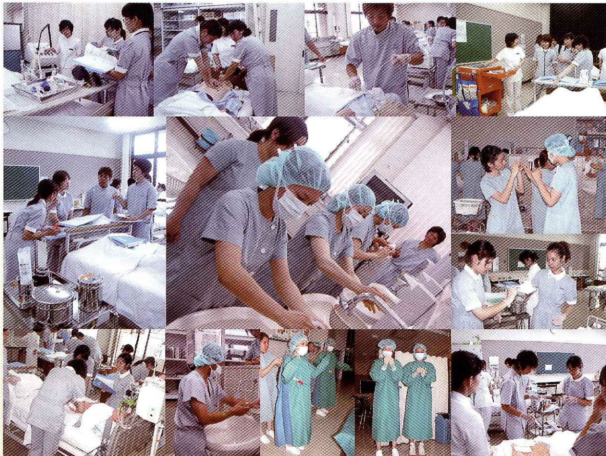
成人保健看護方法Ⅱの臨床看護技術演習